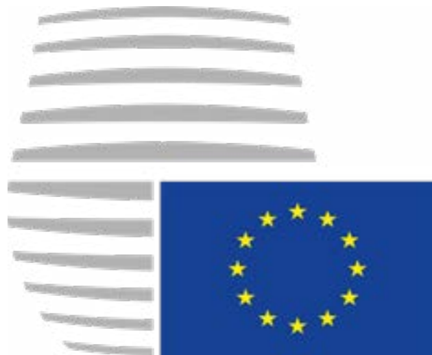
Logo Ufficiale del Consiglio dell'Unione Europea

4. L'astensione al voto dai membri presenti di persona o rappresentati non può prevenire l'adozione di misure sugli atti che richiedono unanimità..